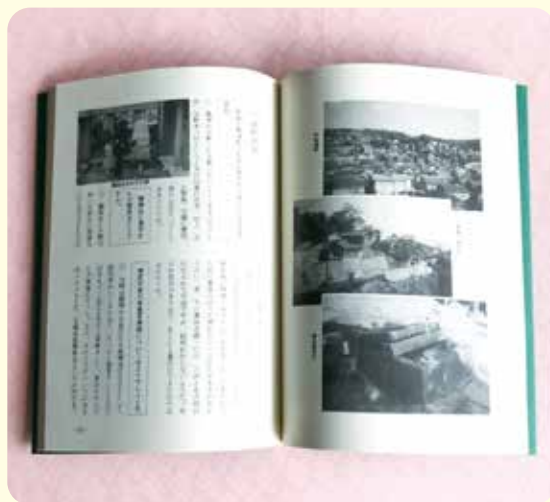
▲懐かしい写真もきれいに復元できました。