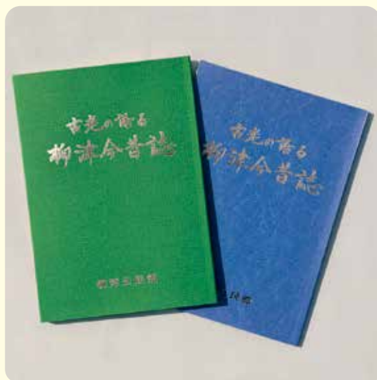
▲青色の表紙(右)が30年以上前の初版本で、緑色の表紙(左)が新しく生まれ変わった再出版本です。

また、今回のように数10年以上前の印刷物を再版することも可能な場合があります。弊社で印刷したものでなくてもかまいません。お気軽にお問い合わせください。